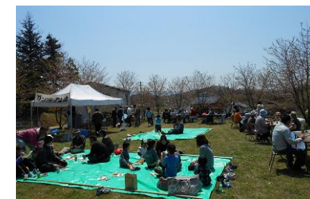
お花見で盛り上がり中

熊野神社の駐車場にて自治会主催の「お花見会」が実施されました。約70名が参加して大変に盛況で楽しい一時を過ごしました。今年は桜の開花が早く、すでに桜の花は散っていましたが、参加者の心は桜の花で満開でした。”しし肉”バーベキュー、たこ焼き、焼そばを食べながら、ビールやお酒を片手に話題が弾みました。