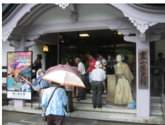
霊山〔りょうざん〕歴史観