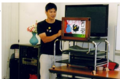
昔懐かしい手づくりの「紙芝居」