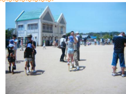
竹馬乗りに苦戦しています

5月25日、長尾幼稚園では、少しでも早い子供の成長を願い、例年より早く全園児対象の保育参観が行われました。園児たちはお父さんやお母さんと一緒に、日歩が丘で遊んだり、年中組は「竹ぼっくり」、年長組は「竹馬づくり」などを行って、親子の楽しいふれあいの一時をすごしました。竹ぼっくりを自在にあやつる子や、竹馬名人が何人も誕生し、親たちも、我が子の予想外の成長に目を細めながら一緒に遊んでいました。